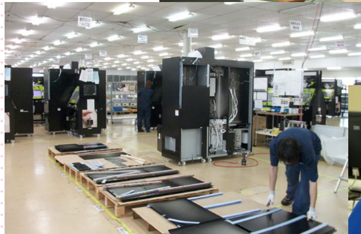
部品調達から完成まで一貫生産できるのが同社の強み。