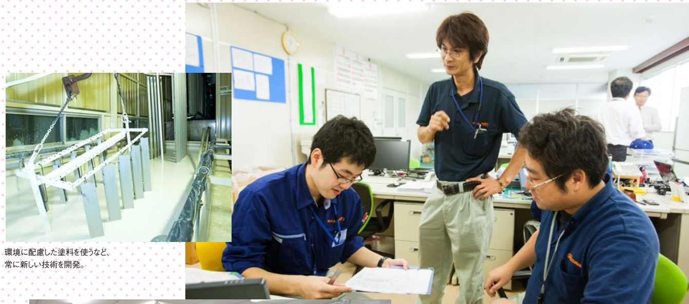
環境に配慮した塗料を使うなど、常に新しい技術を開発。