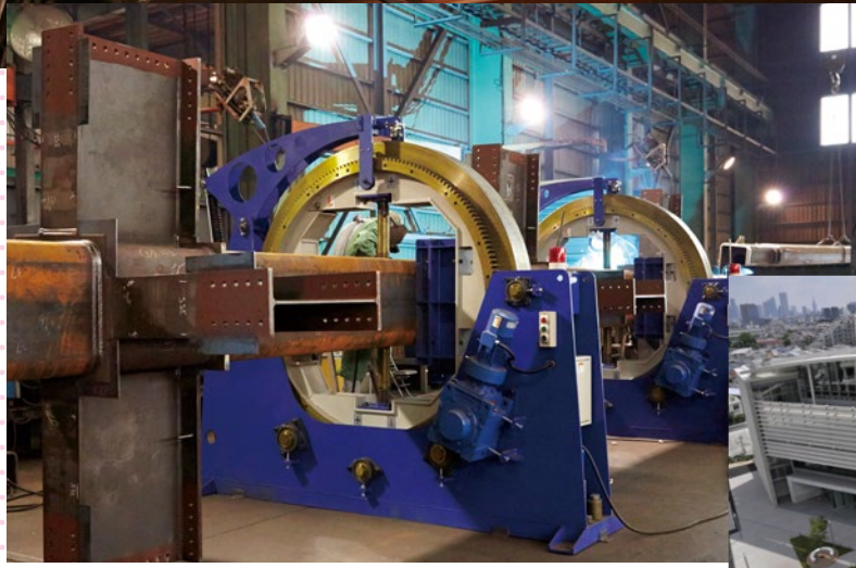
最新鋭の設備を備え、あらゆるニーズに対応している。