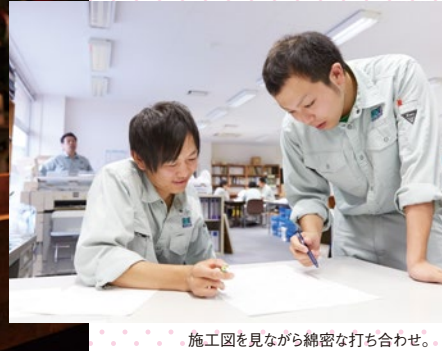
施工図を見ながら綿密な打ち合わせ。