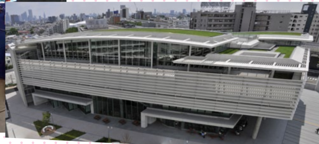
同社の製品が使われている明治大学泉キャンパス新図書館。