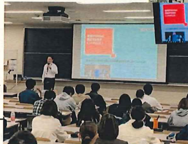
いわてSDG s カフェ講師