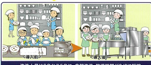
洗浄人員は6名から5名に、食器洗浄・乾燥時間が2/3に短縮