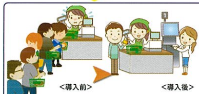
レジの精算時間が1.5倍の速さになり、預り金や釣銭の受け渡しの間違いがなくなった