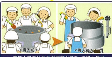
一度に大量の仕込みが可能となり、清掃人員は5名から3名に、1日で100分の清掃時間が短縮