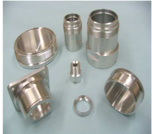
車両用コネクター部品