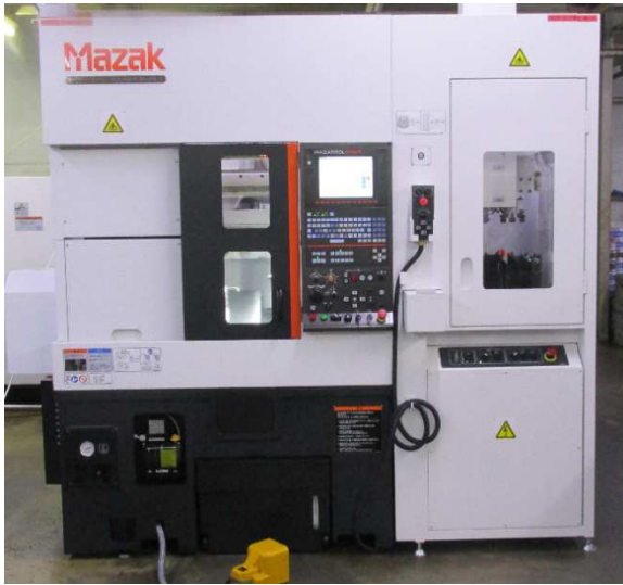
保有機械：CNC 旋盤とガントリーローダー (ヤマザキマザック製)