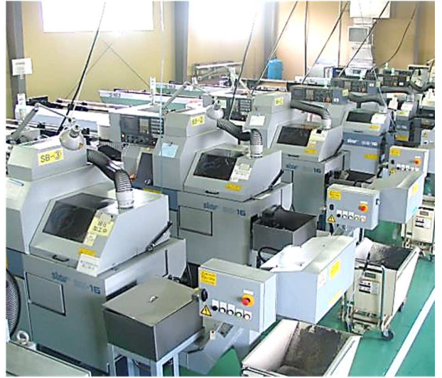
保有機械：NC 自動盤 (スター精密製)