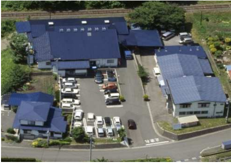
岩手工場（岩手県宮古市）