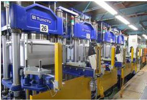
250Ton 自動真空を中心とした 45 台の成型機で試作から量産まで様々な形状に対応します。