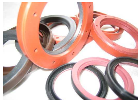
自社開発品、高機能オイルシール各種取り揃え