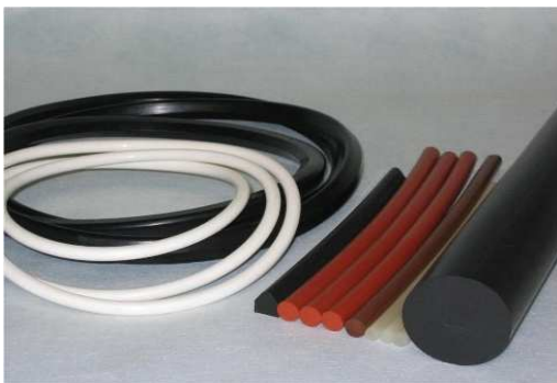
大口径（送り焼き）Oリングは業界最短納期を実現します。