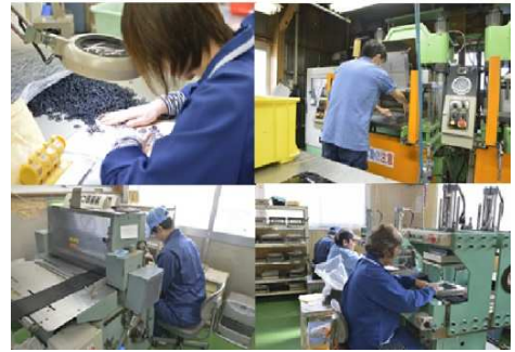
徹底した品質管理で高品質な製品を提供します。