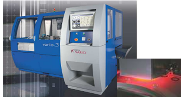
自動画像検査機による画像判別で安定した品質の製品を提供します。