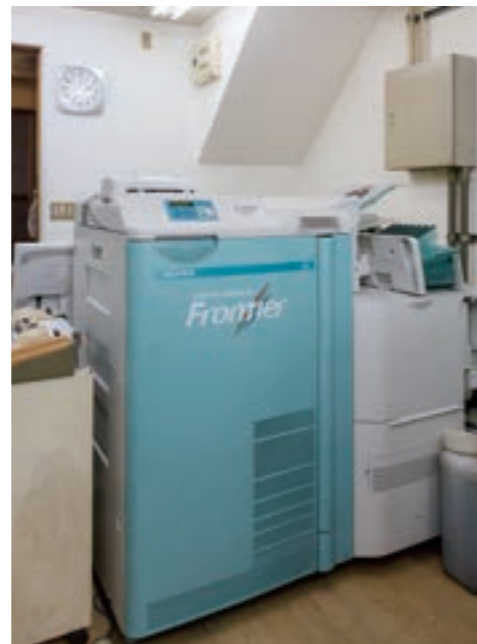
本店に導入した写真現像処理機。大型プリントや製本など内製可能となった。

確にして多様化するお客様のニーズに的確に対応するとともに、業務の効率化を図るため両店舗の体制を整えることが急務であった。