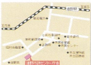
遠野地区合同庁舎