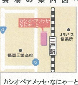
カシオペアメッセ・なにやーと