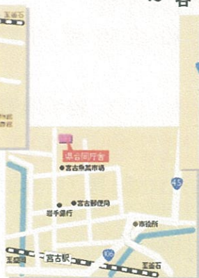
宮古地区合同庁舎