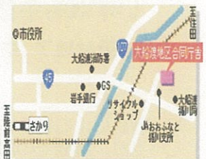
大船渡地区合同庁舎