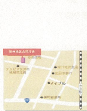
奥州地区合同庁舎